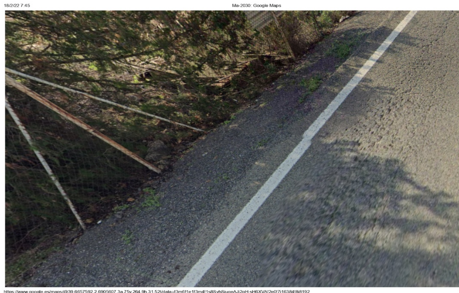
Figura 3. Imatge Google Maps. PQ 1+370

Aquesta escassa entitat dels desperfectes existents al ferm, també es pot apreciar en les següents imatges (figures 3 i 4).